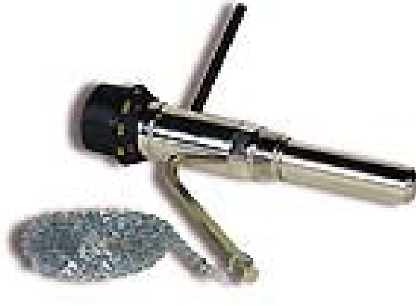
Регулятор тяги RT 10 S